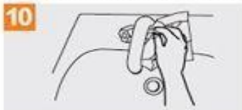
Sírvase de la toalla para cerrar el grifo;