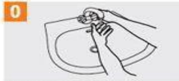
Mójese las manos con agua;

0 Duración de todo el procedimiento: 40-60 segundos