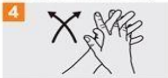
Frótese las palmas de las manos entre sí, con los dedos entrelazados;