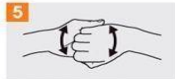
Frótese el dorso de los dedos de una mano con la palma de la mano opuesta, agarrándose los dedos;