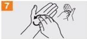
Frótese la punta de los dedos de la mano derecha contra la palma de la mano izquierda, haciendo un movimiento de rotación y viceversa;