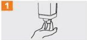
Deposite en la palma de la mano una cantidad de jabón suficiente para cubrir todas las superficies de las manos;