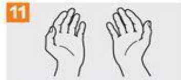
Sus manos son seguras.