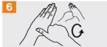
Frótese con un movimiento de rotación el pulgar izquierdo, atrapándolo con la palma de la mano derecha y viceversa;