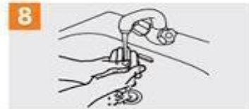
Enjuáguese las manos con agua;