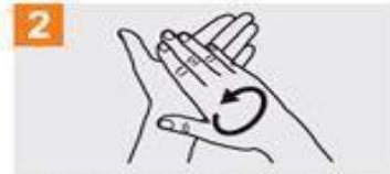
Frótese las palmas de las manos entre sí;